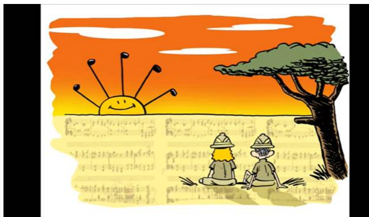
El Despertar de los Animales - El carnaval de los animales de Saint-Saëns

Por último, os enviamos la propuesta de Carmen de música: