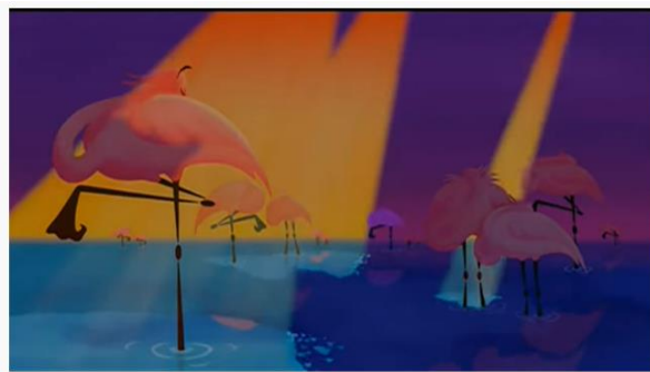
"El carnaval de los animales" de Camille Saint-Saëns

https://www.youtube.com/watch?v=-i-5Dg_o7GI